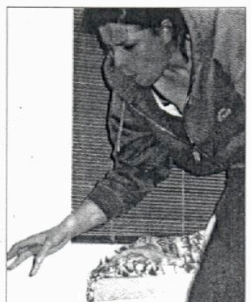
... und Erbrechen.