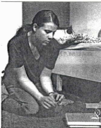
Szenen der Theater-Aufführung: ...